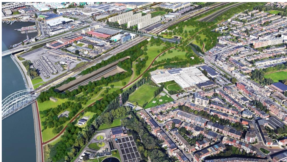
De nieuwe Ring tussen Luchtbal en Merksem met daarop het Ringpark Groenendaal.