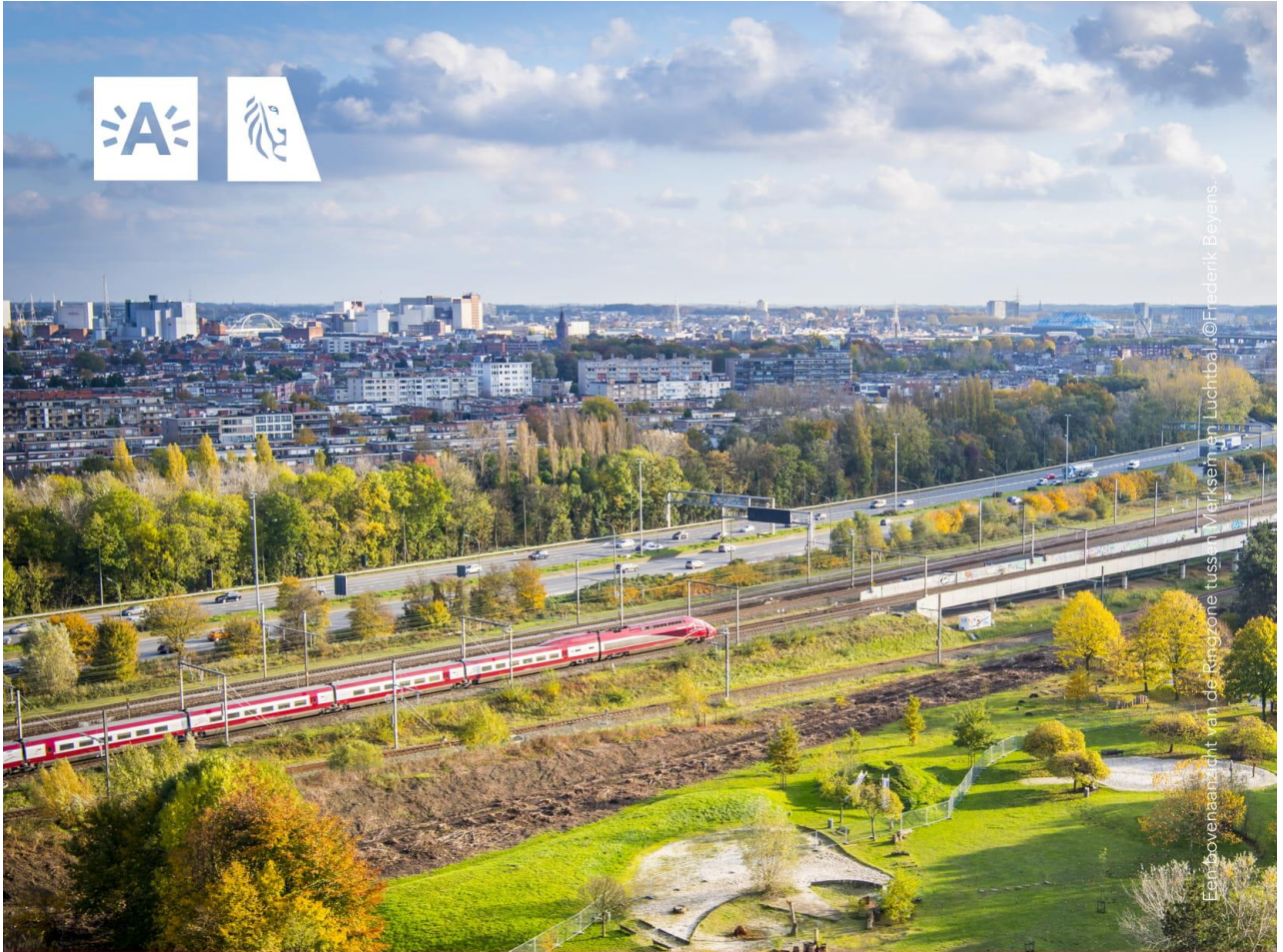
Foto: vovenaaricht van de Ringzone tussen Markein en Luchtbal.